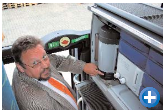
Die Kaffeemaschine von TM befindet sich an der hinteren Einstiegstüre und verrichtet seit über einem Jahr gute Dienste.