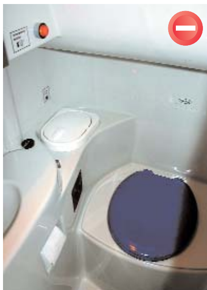
Die Bustoilette selbst ist praktisch, aber der rote Alarmknopf ist so ungünstig platziert, dass er von vielen Benutzern versehentlich gedrückt wird.