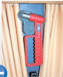
Der Nothammer wird nicht durch Vorhänge verdeckt und ist so sehr gut sichtbar.