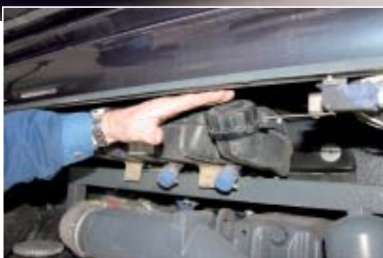
- Das Nachfüllen von Kühlwasser ist nur unter großen Mühen möglich.