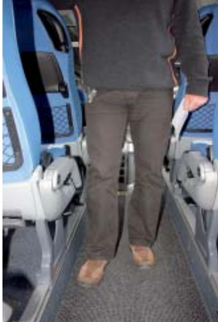
+ Der Durchgang im Safari HD ist breit genug konzipiert.