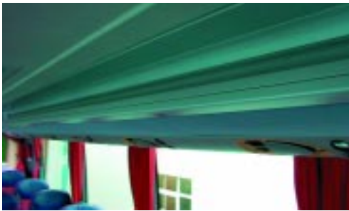
+ Raumgebend: Die Gepäckablagen öffnen den Raum nach oben.