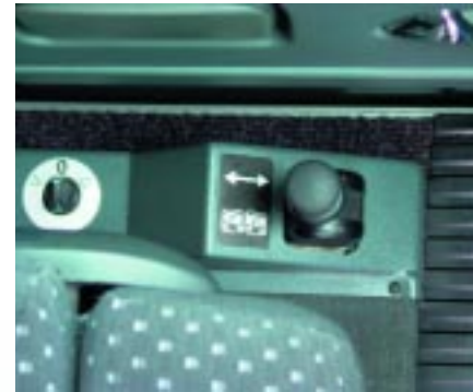
- Sitzt tief: Die Feststellbremse passt nicht zum Konzept des ergonomischen Fahrerarbeitsplatzes.