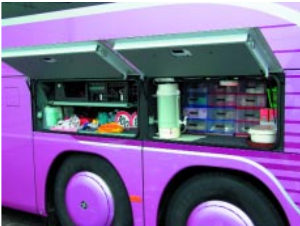
+ Gut genutzt: Zusätzlichen Stauraum bietet der Platz über den Achsen in der HDH-Variante.