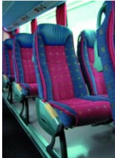
+ Bequemer fahren: Komfortable Sitze machen das Reisen angenehm.