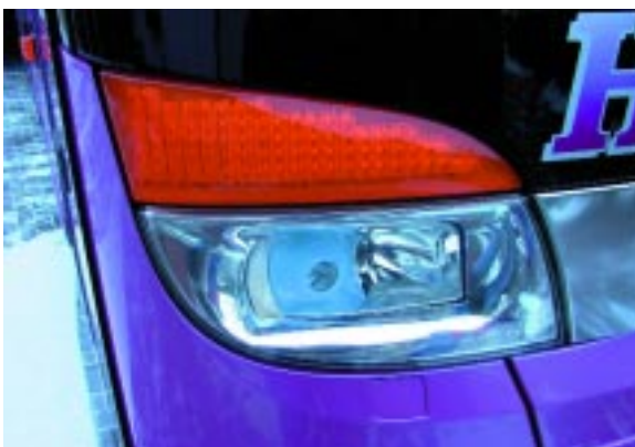
+ Einleuchtend I: Xenon-Licht und LED-Blinker sind besonders hell und gut sichtbar bzw. lassen gut sehen.