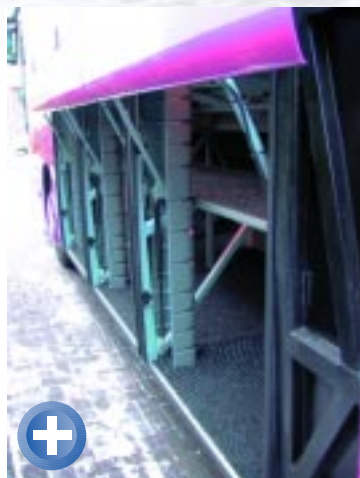
+ Ausreichend: genügend Stauraum im Gepäckraum, dessen Klappen parallel zum Bus hoch schwenken.