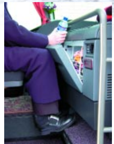
- Klappt nicht: Die Klappe des Kühlschranks schlägt an die Beine des Reiseleiters.