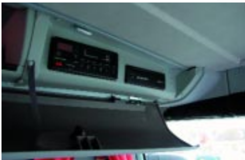
+ Verschluss: Die Video-Anlage sitzt in den abschließbaren Fächern über dem Fahrerplatz.